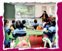
AC SMART CLASSROOMS