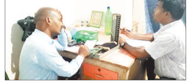
क्लीनिक की जांच करने पहुंचे अफसर।

बगैर दस्तावेजों के चल रहे 2 क्लीनिक को सील किया गया है। साथ ही बड़ी संख्या में दवाइयां भी जब्त की गई है। मामला सक्ती एवं टेमर गांव का है। उक्त कार्रवाई नर्सिंग होम एक्ट के तहत की गई है। जिसके चलते अवैध क्लीनिक संचालकों में हडकंप मच गया है।