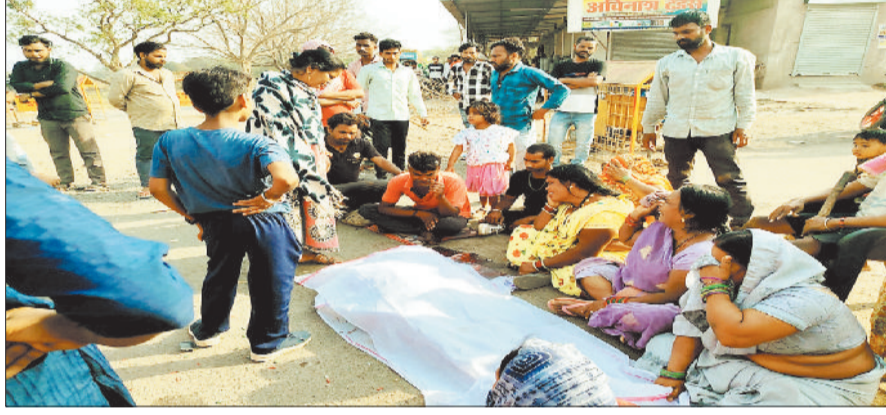
सड़क पर शव रखकर चक्काजाम करते परिजन व नगरवासी।

बनाहिल चौक में पिक अप वाहन की चपेट में आने से एक महिला की मौत हो गई। घटना से आक्रोशित ग्रामीणों ने सड़क पर शव रख कर चक्का जाम कर दिया। अधिकारियों की समझाइश पर 4 घंटे बाद चक्का जाम समाप्त हुआ। इस दौरान अकलतरा- बिलासपुर मार्ग पर आवागमन बाधित रहा।