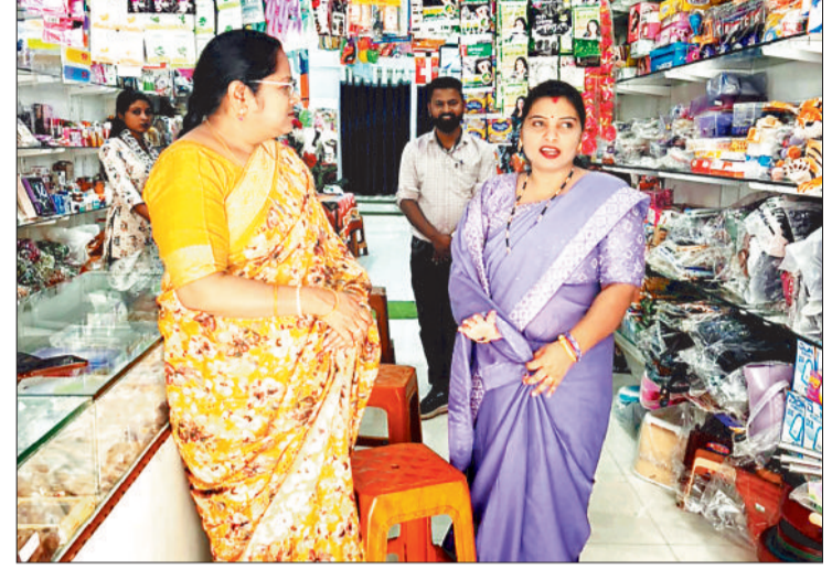
आकस्मिक निरीक्षण के दौरान हितग्राहियों से चर्चा करती खादी एवं ग्रामोद्योग बोर्ड की प्रबंध संचालक।

खादी एवं ग्रामोद्योग बोर्ड की प्रबंध संचालक ने ग्राम पंचायत सकरेलीकला एवं ग्राम पंचायत पोरेथा पहुंचकर रोजगार योजनाओं की प्रगति का जायजा लिया। उन्होंने ग्रामीण क्षेत्रों के लोगों को विभागीय योजनाओं की जानकारी देकर अधिक से अधिक लोगों को स्वरोजगार से जोड़ने पर जोर दिया।